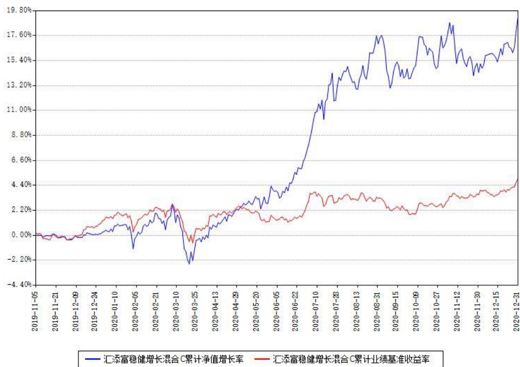
汇添富稳健增长混合C累计净值增长率与同期业绩基准收益率对比图