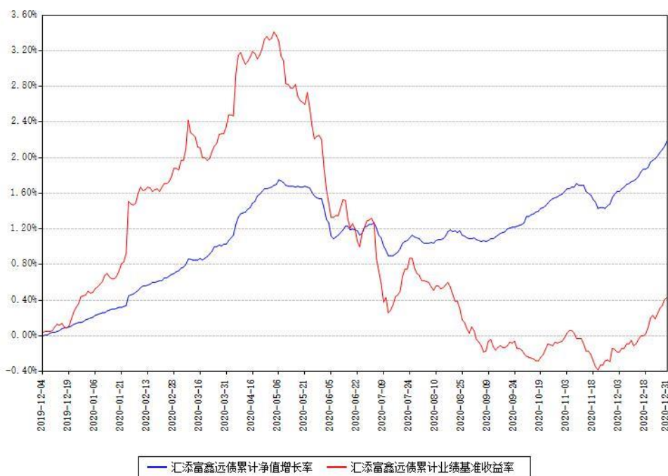
汇添富鑫远债券累计净值增长率与同期业绩基准收益率对比图

(二) 自基金合同生效以来基金累计净值增长率变动及其与同期业绩比较基准收益率变动的比较图