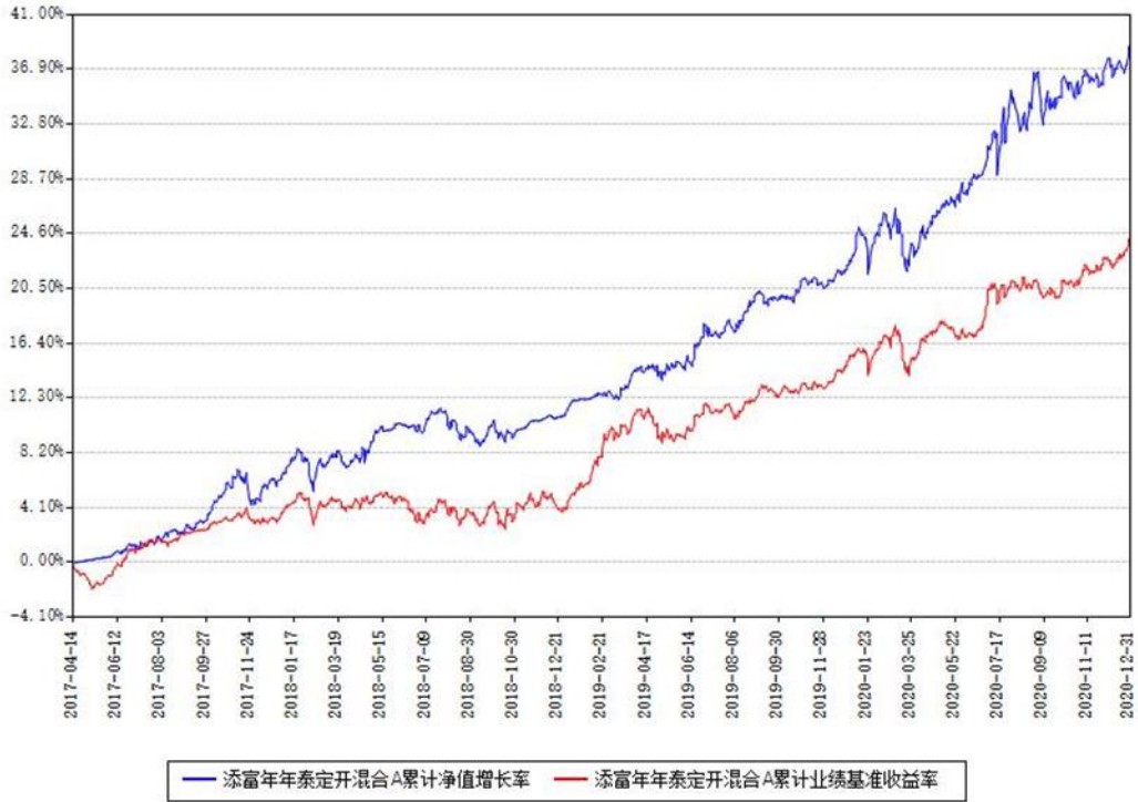
添富年年泰定开混合A累计净值增长率与同期业绩基准收益率对比图