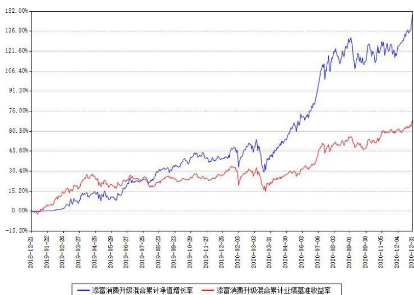
添富消费升级混合累计净值增长率与同期业绩基准收益率对比图