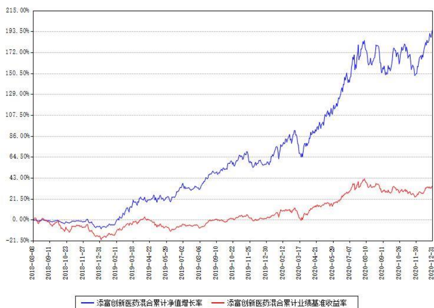
添富创新医药混合累计净值增长率与同期业绩基准收益率对比图

(二) 自基金合同生效以来基金累计净值增长率变动及其与同期业绩比较基准收益率变动的比较图