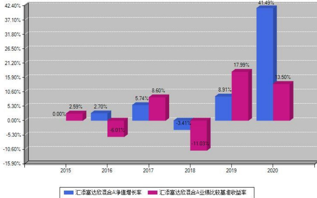
汇添富达欣混合A每年净值增长率与同期业绩基准收益率对比图

注：基金的过往业绩不代表未来表现。本《基金合同》生效之日为2015年12月02日，合同生效当年按实际存续期计算，不按整个自然年度进行折算。