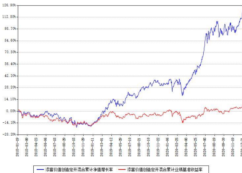
添富价值创造定开混合累计净值增长率与同期业绩基准收益率对比图

(二) 自基金合同生效以来基金累计净值增长率变动及其与同期业绩比较基准收益率变动的比较图