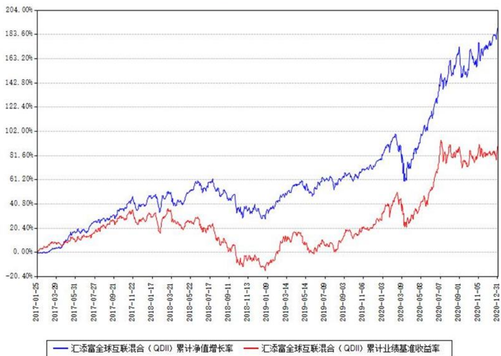
汇添富全球互联混合（QDII）累计净值增长率与同期业绩基准收益率对比图