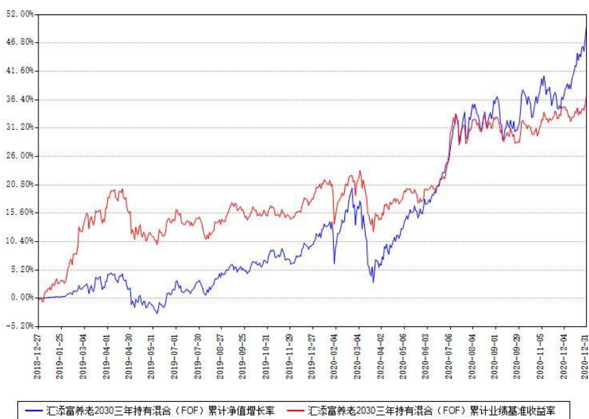
汇添富养老2030三年持有混合 (FOF) 累计净值增长率与同期业绩基准收益率对比图