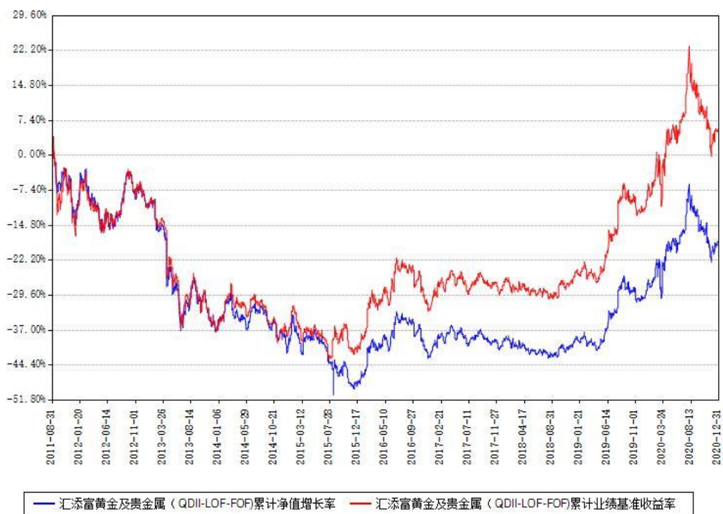
汇添富黄金及贵金属 (QDII-LOF-FOF) 累计净值增长率与同期业绩基准收益率对比图