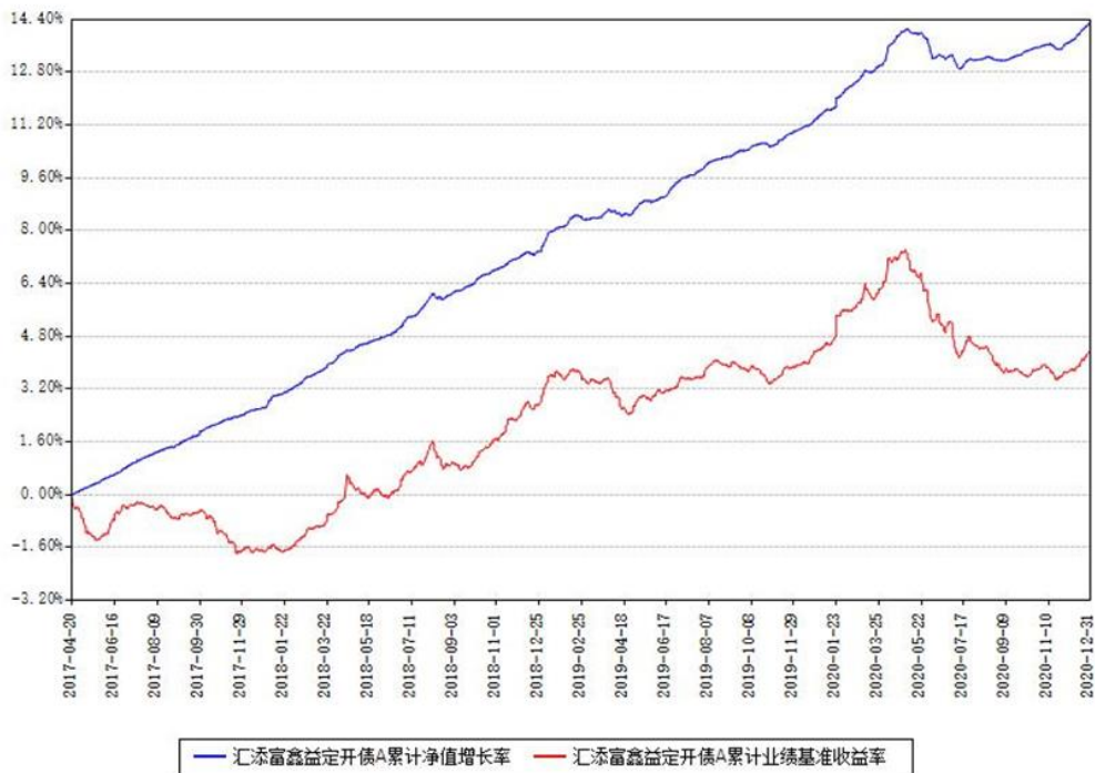
汇添富鑫益定开债A累计净值增长率与同期业绩基准收益率对比图