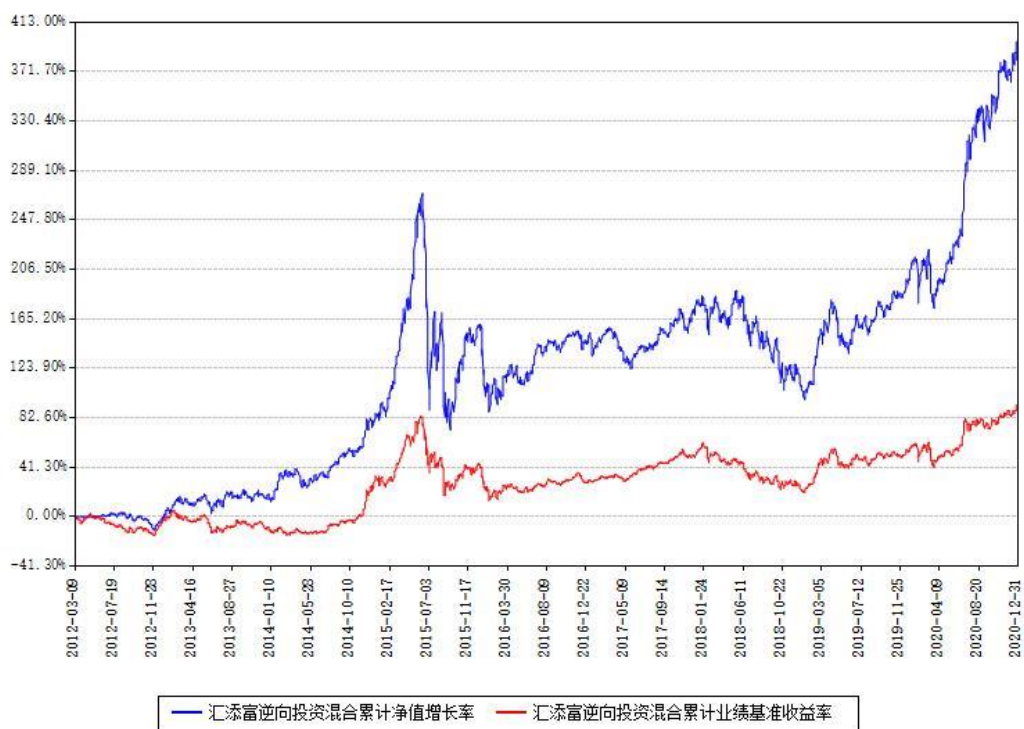
汇添富逆向投资混合累计净值增长率与同期业绩基准收益率对比图