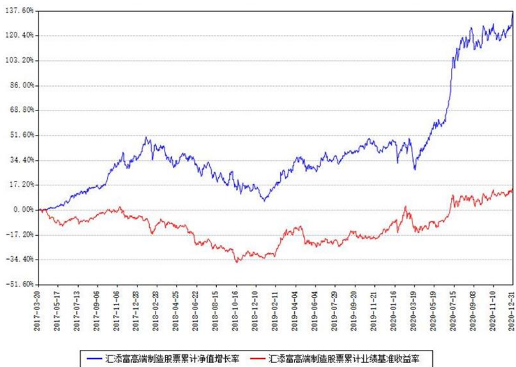
汇添富高端制造股票累计净值增长率与同期业绩基准收益率对比图