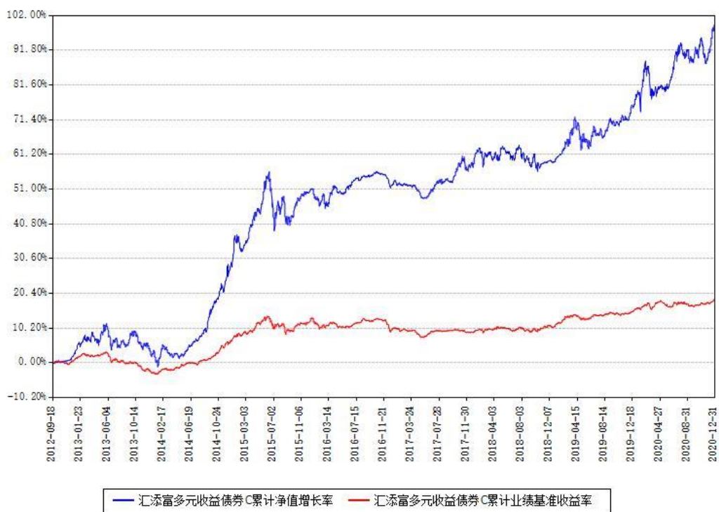
汇添富多元收益债券C累计净值增长率与同期业绩基准收益率对比图