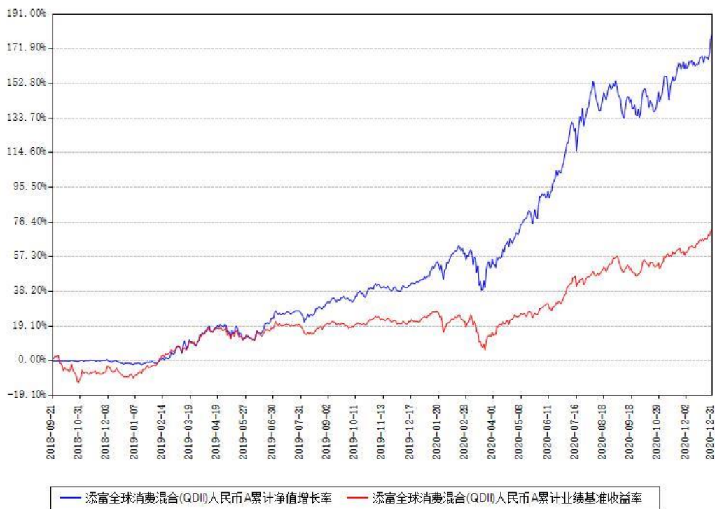
添富全球消费混合(QDII)人民币A累计净值增长率与同期业绩基准收益率对比图