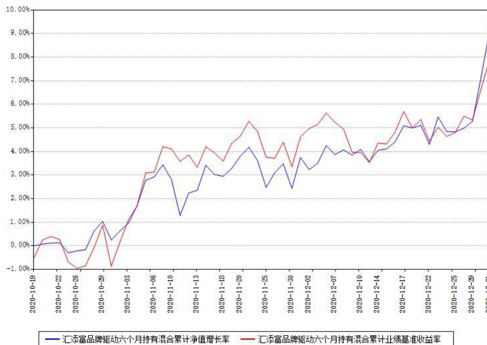
汇添富品牌驱动六个月持有混合累计净值增长率与同期业绩基准收益率对比图