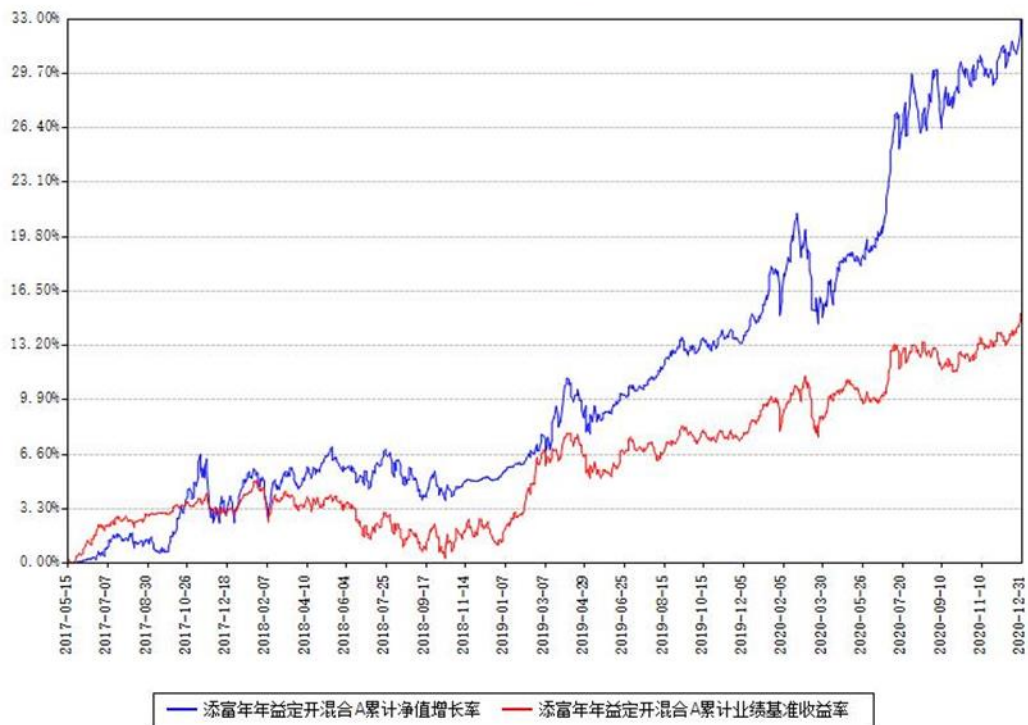
添富年年益定开混合A累计净值增长率与同期业绩基准收益率对比图