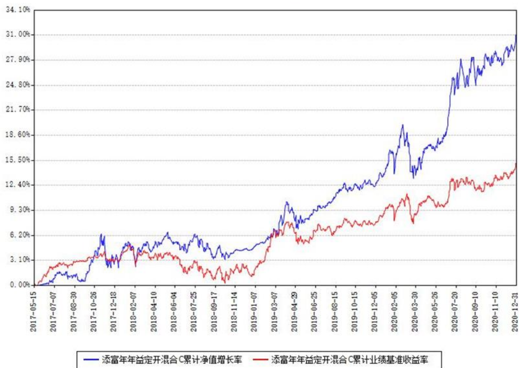
添富年年益定开混合C累计净值增长率与同期业绩基准收益率对比图