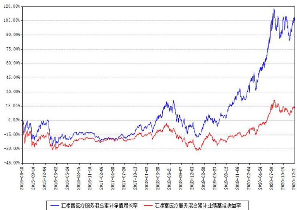
汇添富医疗服务混合累计净值增长率与同期业绩基准收益率对比图