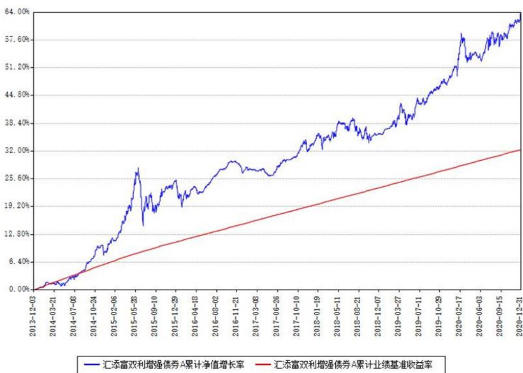
汇添富双利增强债券A累计净值增长率与同期业绩基准收益率对比图