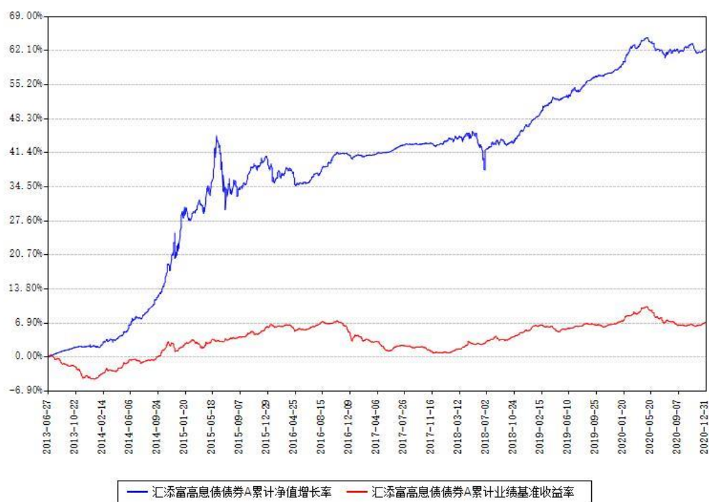
汇添富高息债券 A 累计净值增长率与同期业绩基准收益率对比图