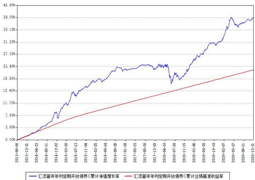
汇添富年年利定期开放债券C累计净值增长率与同期业绩基准收益率对比图