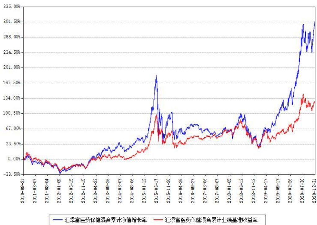
汇添富医药保健混合累计净值增长率与同期业绩基准收益率对比图