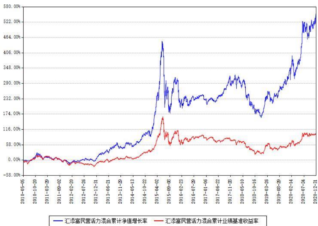
汇添富民营活力混合累计净值增长率与同期业绩基准收益率对比图