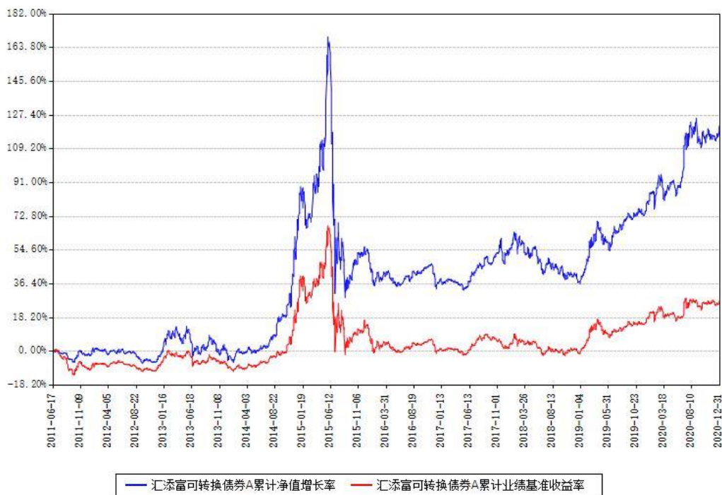
汇添富可转换债券A累计净值增长率与同期业绩基准收益率对比图