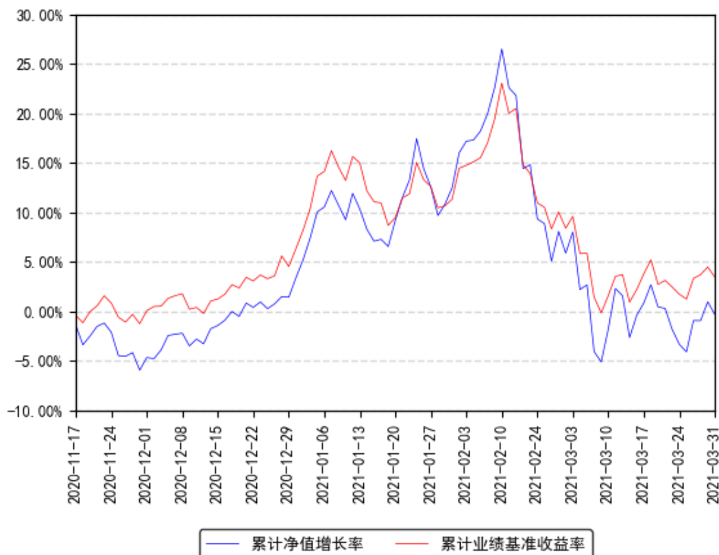
南方消费累计净值增长率与同期业绩比较基准收益率的历史走势对比图