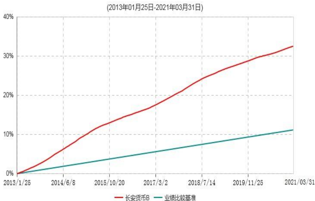
长安货币B累计净值收益率与业绩比较基准收益率历史走势对比图

本基金的收益分配是按月结转份额。按基金合同规定，本基金自基金合同生效起 6 个月为建仓期，截止到建仓期结束时，本基金的各项投资组合比例已符合基金合同的相关规定。图示日期为 2013 年 01 月 25 日至 2021 年 03 月 31 日。