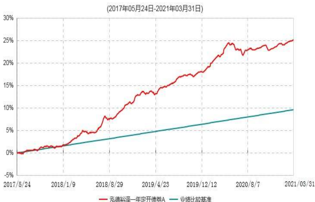
泓德裕泽一年定开债券A累计净值增长率与业绩比较基准收益率历史走势对比图