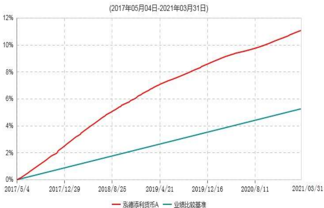
泓德添利货币A累计净值收益率与业绩比较基准收益率历史走势对比图