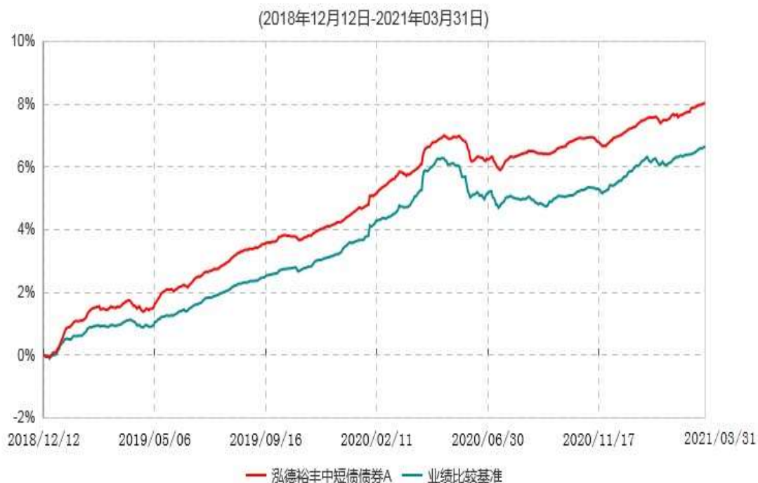
泓德裕丰中短债债券A累计净值增长率与业绩比较基准收益率历史走势对比图