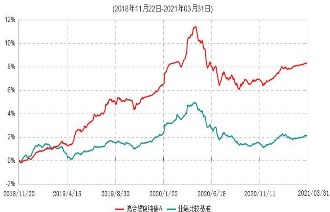
嘉合磐稳纯债A累计净值增长率与业绩比较基准收益率历史走势对比图