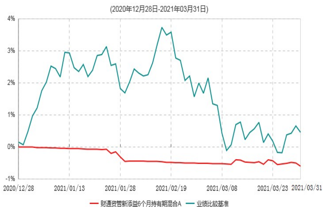
财通资管新添益6个月持有期混合A累计净值增长率与业绩比较基准收益率历史走势对比图