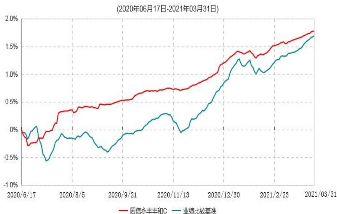
圆信永丰丰和C累计净值增长率与业绩比较基准收益率历史走势对比图

注：自基金合同生效后，截止报告期末，本基金成立不满一年；本基金已完成建仓但报告期末距建仓结束不满一年，建仓结束时各项资产配置比例符合合同约定。