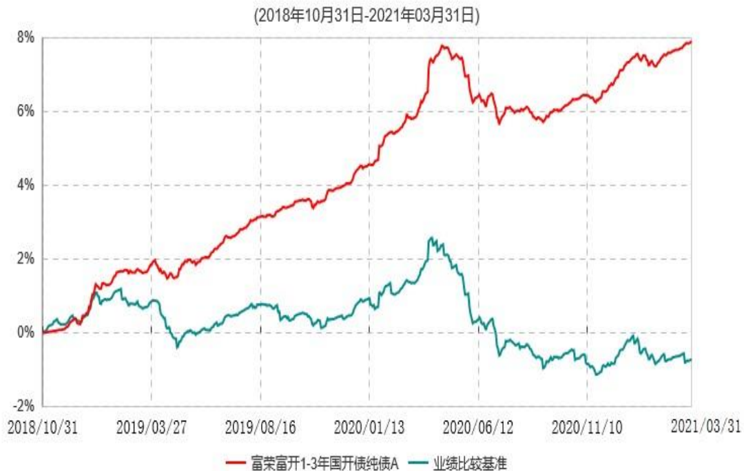
富荣富开1-3年国开债纯债A累计净值增长率与业绩比较基准收益率历史走势对比图