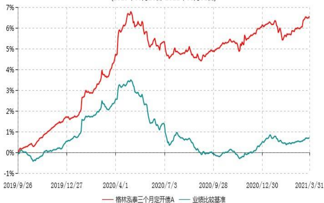
格林泓泰三个月定开债A累计净值增长率与业绩比较基准收益率历史走势对比图 (2019年09月26日-2021年03月31日)