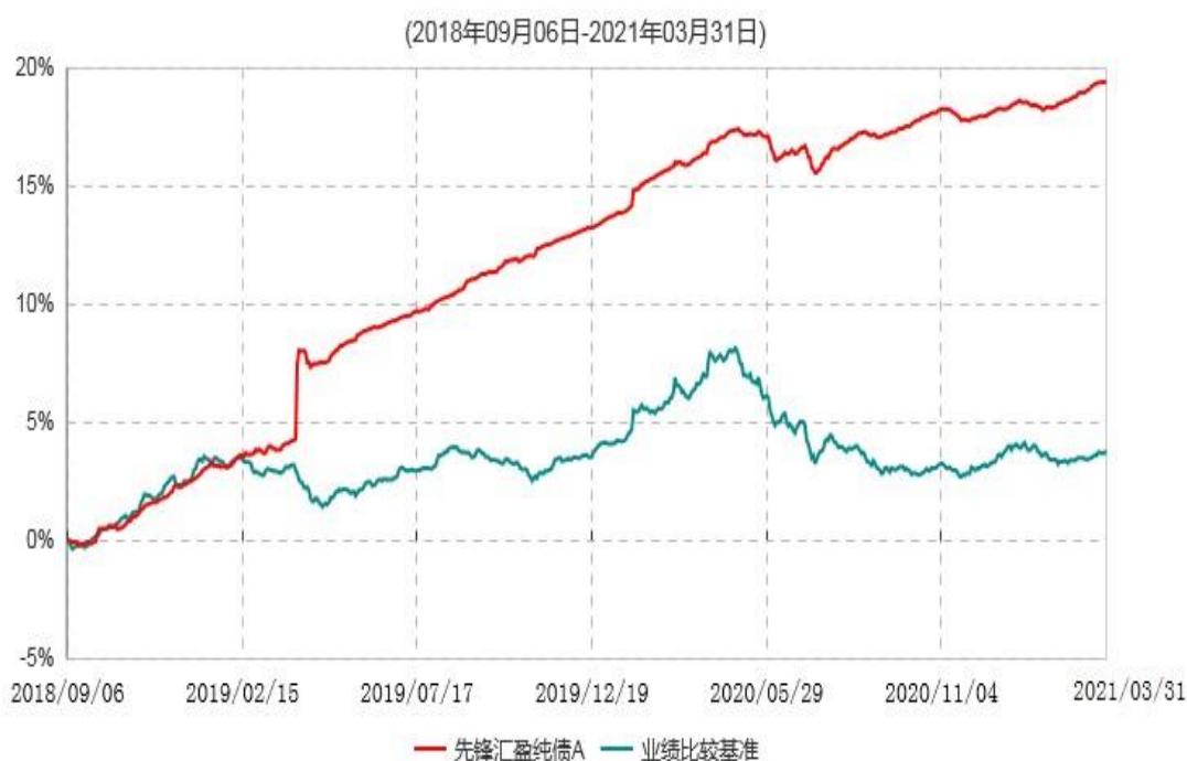
先锋汇盈纯债A累计净值增长率与业绩比较基准收益率历史走势对比图