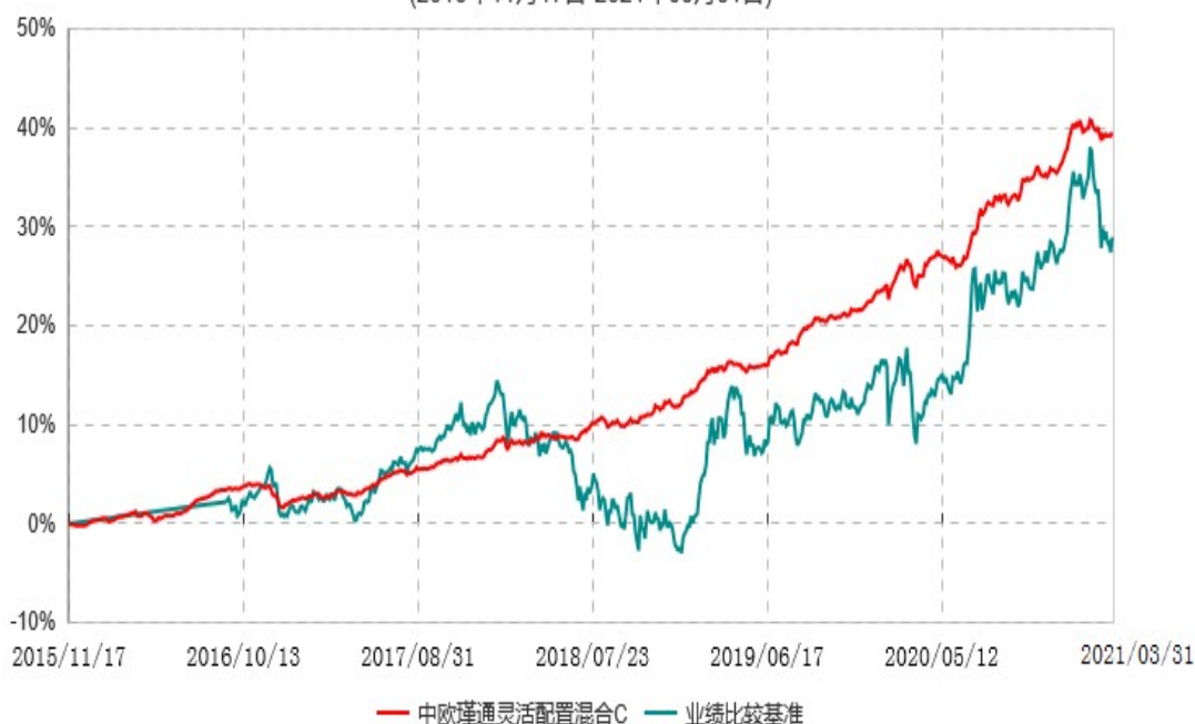
中欧瑾通灵活配置混合C累计净值增长率与业绩比较基准收益率历史走势对比图 (2015年11月17日-2021年03月31日)

注：自 2016 年 9 月 5 日起，业绩比较基准由金融机构人民币三年期定期存款基准利率（税后）变更至沪深 300 指数收益率*50%+中债综合指数收益率*50%。