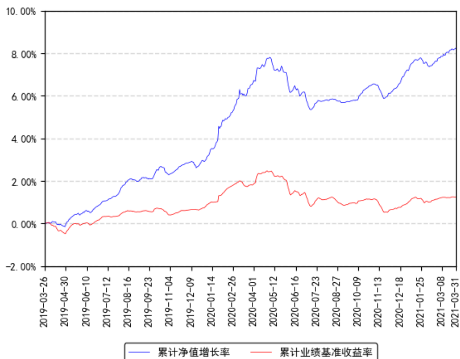
南方惠利6个月定开债券A累计净值增长率与同期业绩比较基准收益率的历史走势对比图