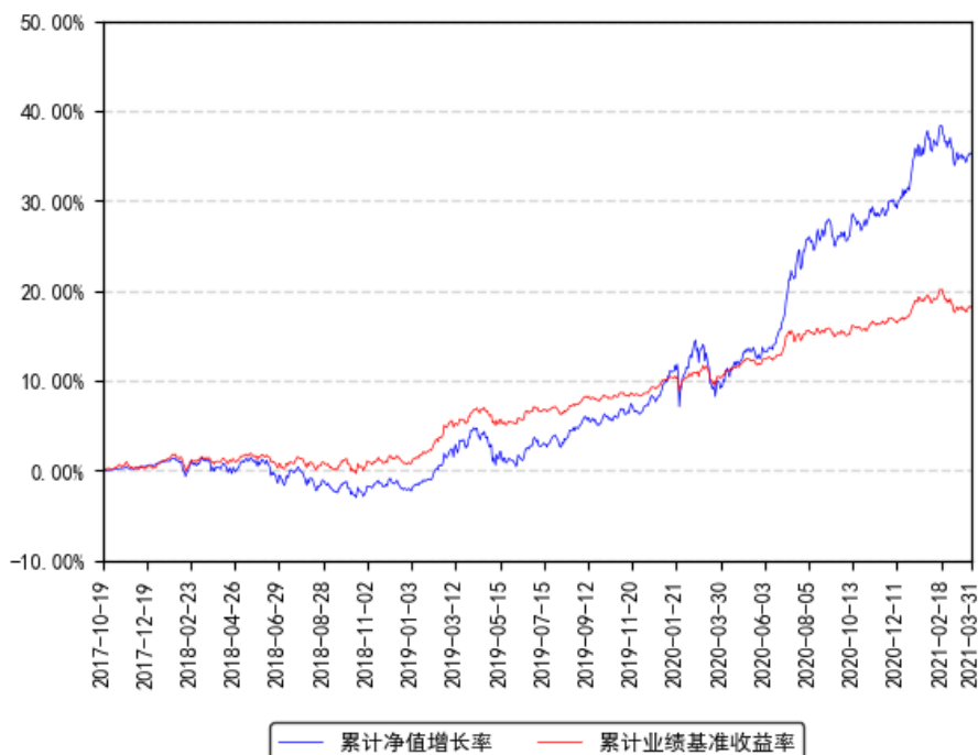
南方全天候策略混合 (FOF)A 累计净值增长率与同期业绩比较基准收益率的历史走势对比图