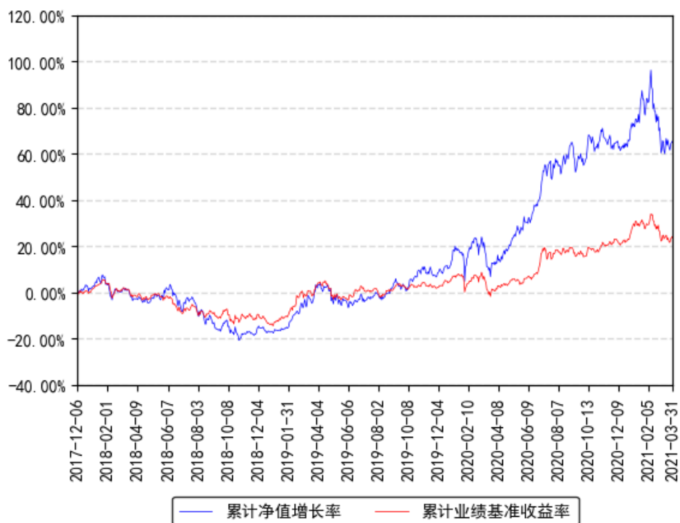
南方优享分红混合A累计净值增长率与同期业绩比较基准收益率的历史走势对比图