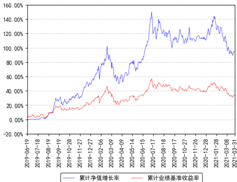
南方信息创新混合A累计净值增长率与同期业绩比较基准收益率的历史走势对比图