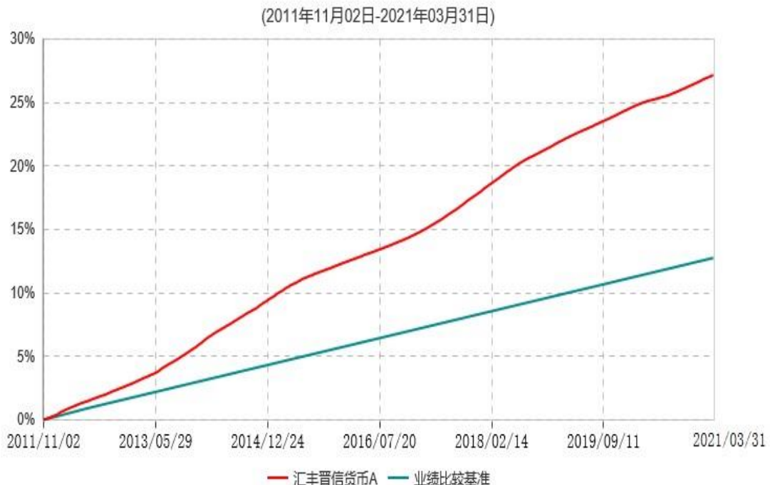
汇丰晋信货币A累计净值收益率与业绩比较基准收益率历史走势对比图