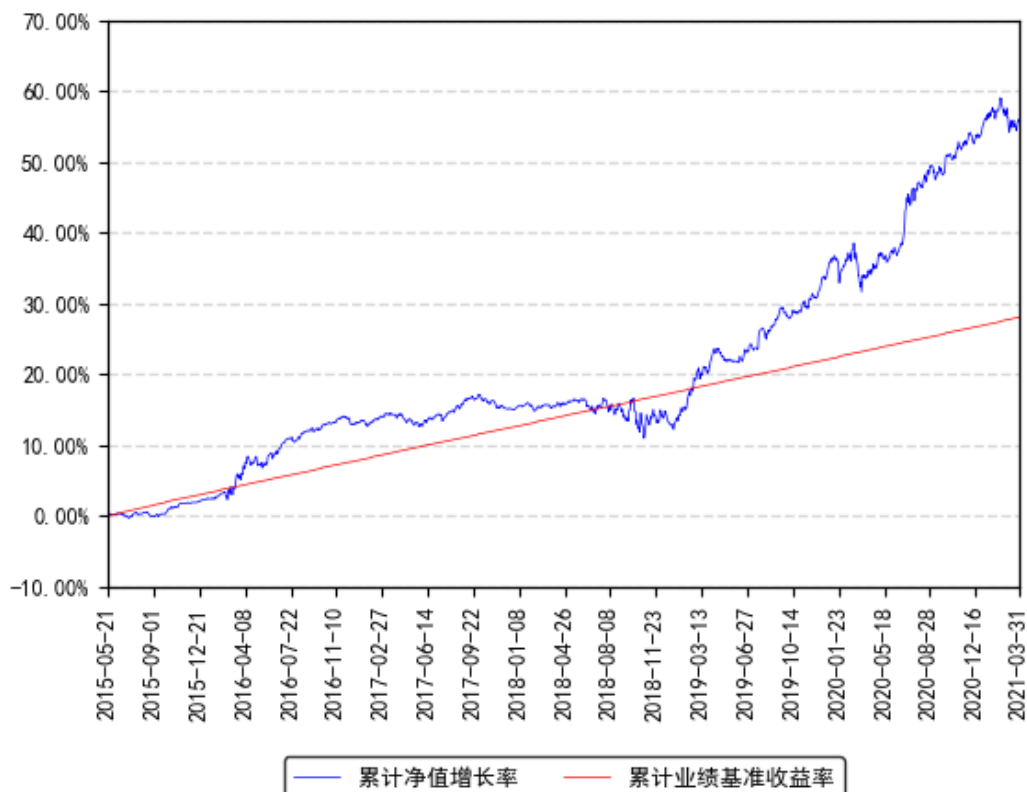
南方利众A类累计净值增长率与同期业绩比较基准收益率的历史走势对比图