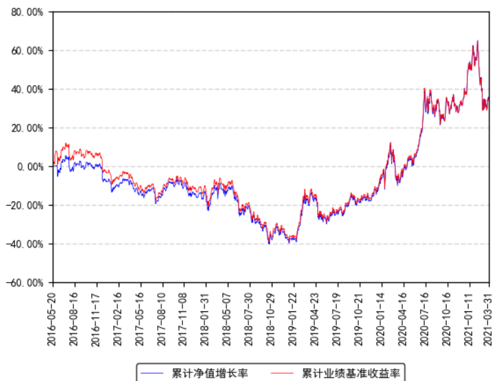
南方创业板ETF联接A累计净值增长率与同期业绩比较基准收益率的历史走势对比图