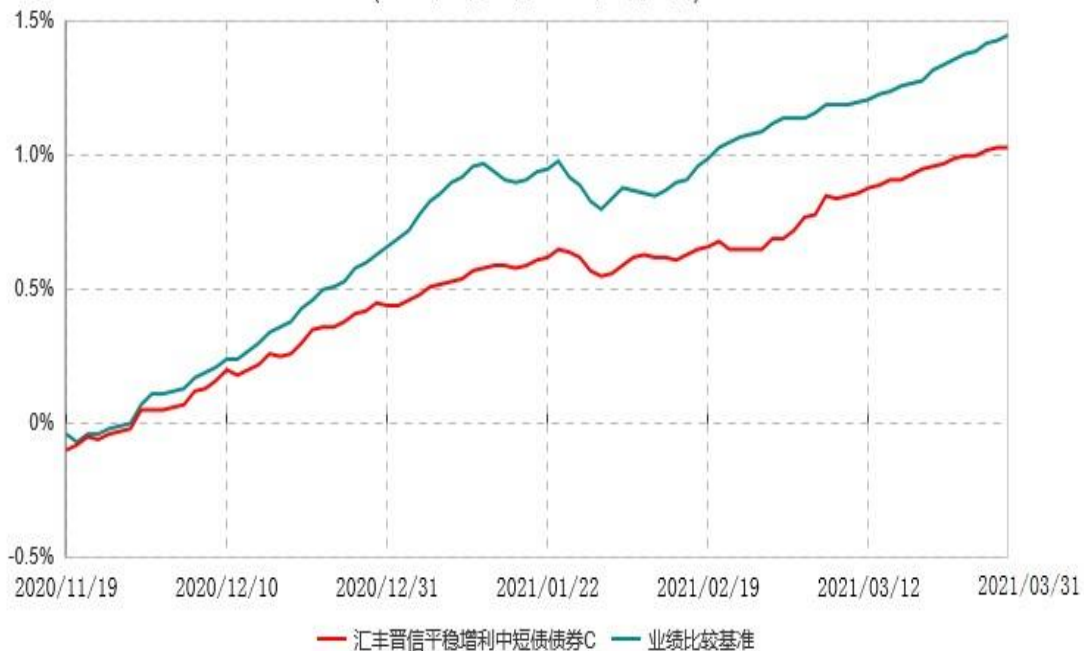
汇丰晋信平稳增利中短债债券C累计净值增长率与业绩比较基准收益率历史走势对比图 (2020年11月19日-2021年03月31日)

注：1. 自 2020 年 11 月 19 日起，原汇丰晋信平稳增利债券型证券投资基金转型为汇丰晋信平稳增利中短债债券型证券投资基金，汇丰晋信平稳增利中短债债券型证券投资基金基金合同正式生效，截至 2021 年 3 月 31 日基金合同生效未满 1 年。 2. 按照基金合同的约定，基金的投资组合比例为：本基金投资于债券的比例不低于基金资产的 80%，其中投资于剩余期限不超过三年（含三年）的债券资产的比例不低于非现金资产的 80%；持有现金或到期日在 1 年以内的政府债券不低于基金资产净值的 5%，其中现金不包括结算备付金、存出保证金和应收申购款等。本基金投资的信用债券的债项评级或主体评级须在 AA+（含 AA+）以上，本基金投资于 AA+ 级别信用债的比例不高于基金资产的 70%；投资于 AAA 级别信用债的比例不高于基金资产的 95%。 3. 本基金自基金合同生效日起不超过六个月内完成建仓。截止 2021 年 3 月 31 日尚未完