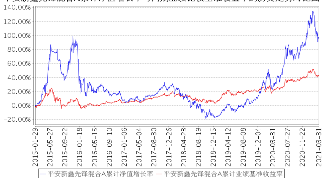
平安新鑫先锋混合A累计净值增长率与同期业绩比较基准收益率的历史走势对比图