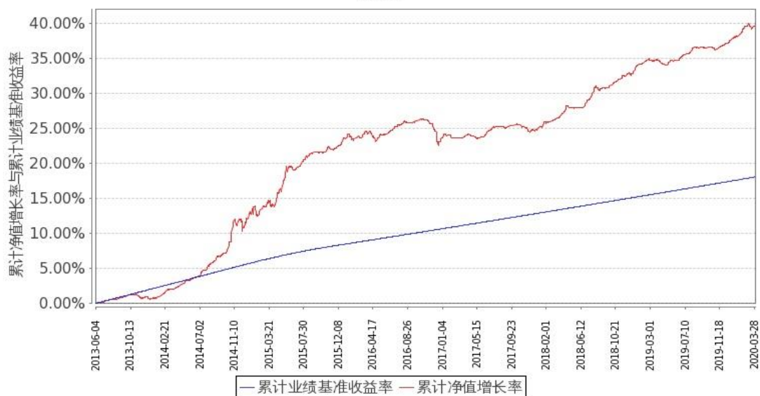
图 2：嘉实如意宝定期债券 C 基金份额累计净值增长率与同期业绩比较基准收益率的历史走势对比图