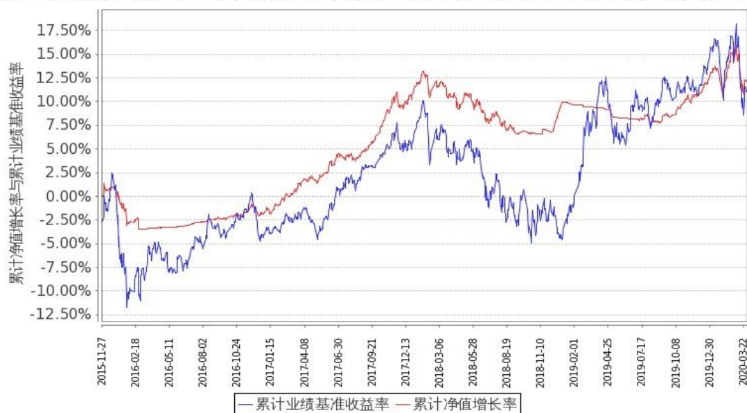
图 1：嘉实新起点混合 A 基金份额累计净值增长率与同期业绩比较基准收益率的历史走势对比图