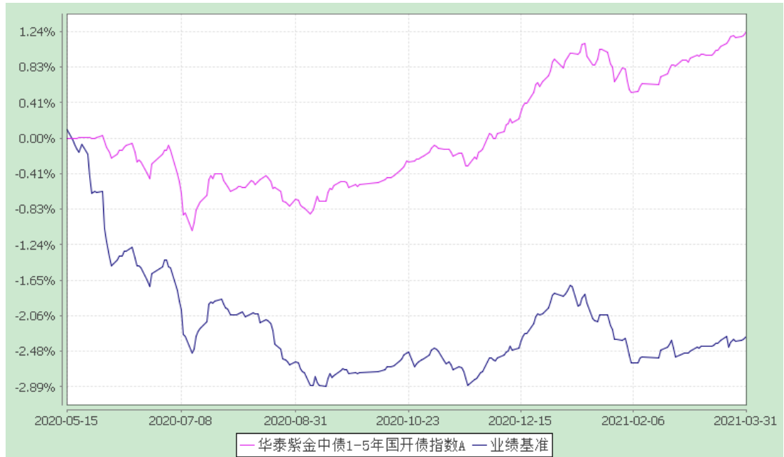
2. 华泰紫金中债 1-5 年国开债指数 A: