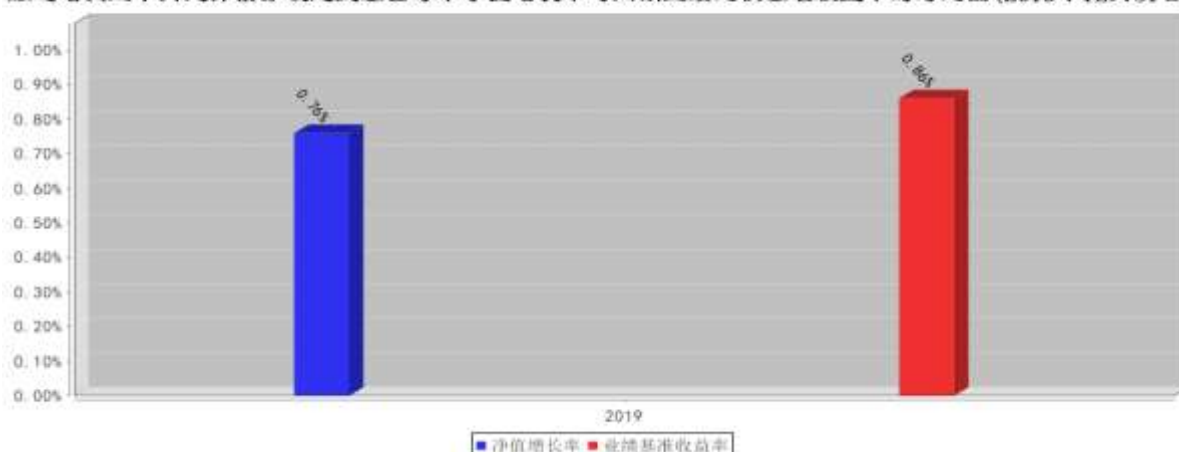
融通增润三个月定期开放债券型发起式基金每年净值增长率与同期业绩比较基准收益率的对比图(2019年12月31日)