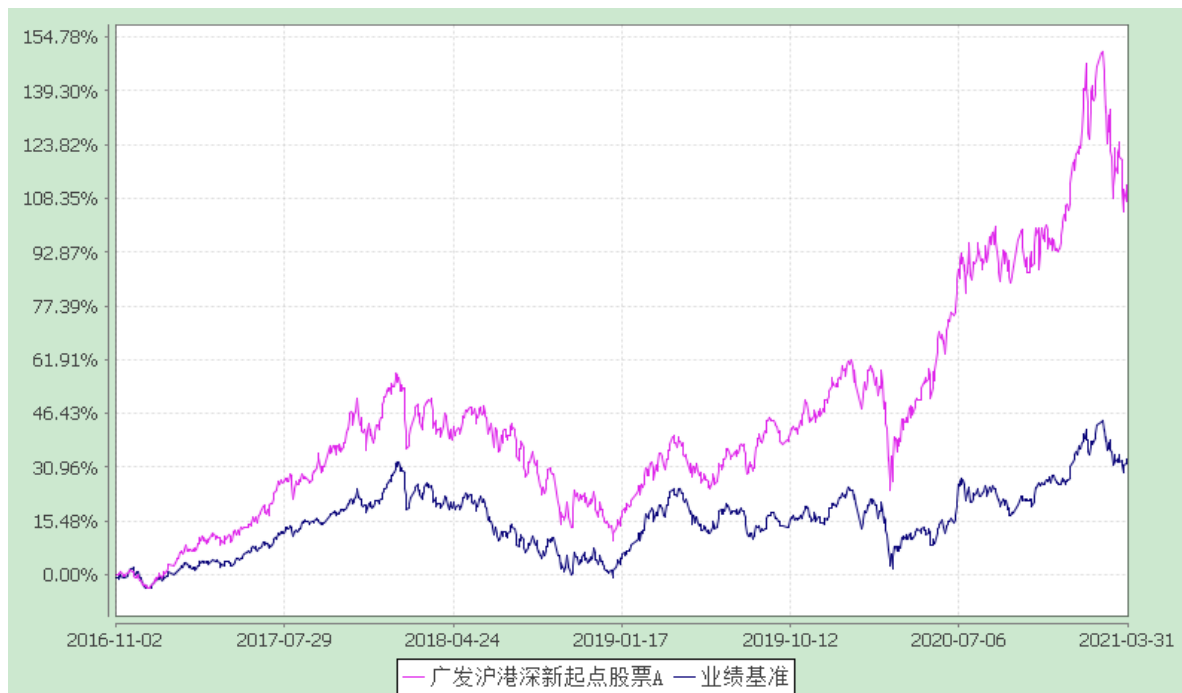
广发沪港深新起点股票 C: